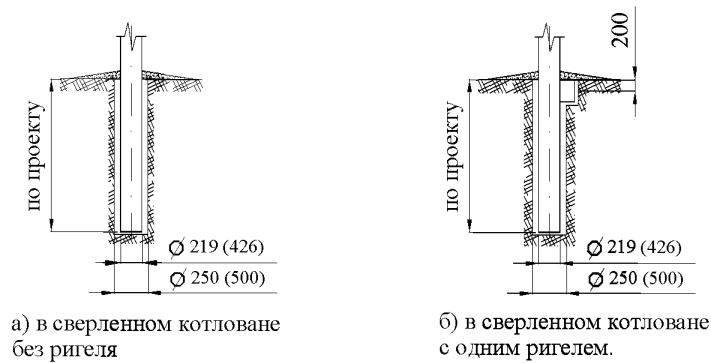
Рис. 3.1. Схема разработки котлованов

2.6. При величине заглубления фундамента превышающей возможности имеющихся машин, допускается забивка труб фундамента дизель-молотом. Тип и конструктивные размеры оголовка, соединяющего трубу фундамента с дизель-молотом, зависят от диаметра трубы фундамента и типа дизель-молота. Данная схема установки фундамента определяется проектом производства работ и в настоящей технологической карте не рассматривается.