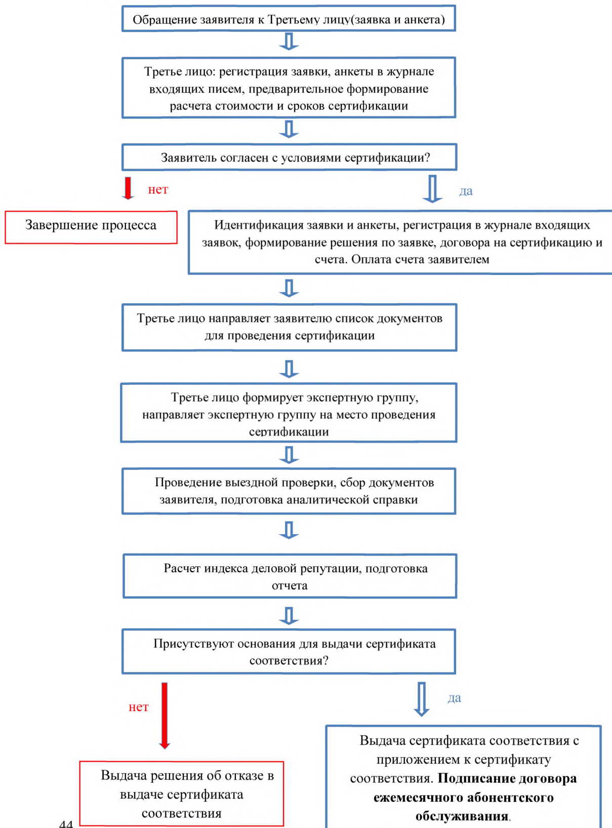
Схема сертификации №1.