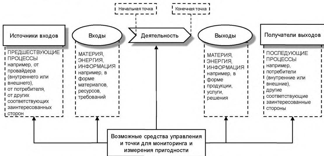
Рисунок 1 – Схематичное представление элементов отдельного процесса

На рисунке 1 схематично представлен любой процесс и показаны взаимодействия между его элементами. Точки мониторинга и измерений, которые необходимы для управления, конкретны для каждого процесса и будут варьироваться в зависимости от связанных рисков.