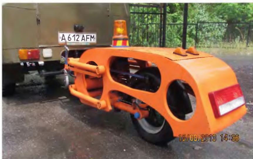
Рисунок 1 - Внешний вид оборудования ПКРС-2У

5.1.2 Основные параметры прицепной установки и краткая характеристика: