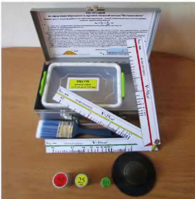
Рисунок 3 – Измерительное средство «Песчаное пятно»

7.1 В качестве измерительного оборудования следует использовать измерительное средство «Песчаное пятно» (см. Рисунок 3).