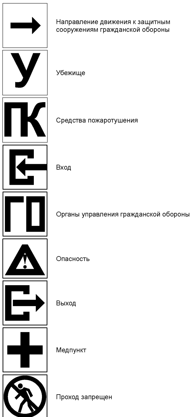
Рисунок Л.1 — Световые знаки, работающие в режимах частичного затемнения и ложного освещения

Виды световых знаков приведены на рисунке Л.1, начертание их символов в модульной сетке — на рисунке Л.2.