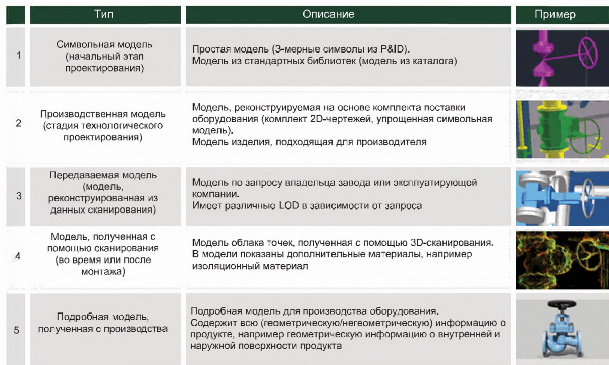
Рисунок 1 — Классификация модели заводского оборудования в зависимости от уровня детализации

В зависимости от требований к точности модели физической сущности используют различные уровни детализации (LOD). Перечень моделей в зависимости от уровня детализации на примере клапана приведен на рисунке 1.