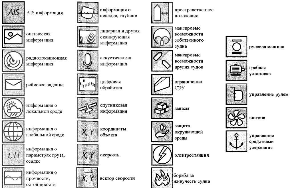
Рис. Б-3 Пояснение используемых на рис. Б-1 и Б-2 пиктограмм

2.4 Проверка проводится или в ходе натуральных испытаний (например ходовых испытаний), или с применением номерной версии ПО системы управления МАНС, или на номерной версии ПО виртуальной платформы моделирования навигационной обстановки, при взаимодействии которых: