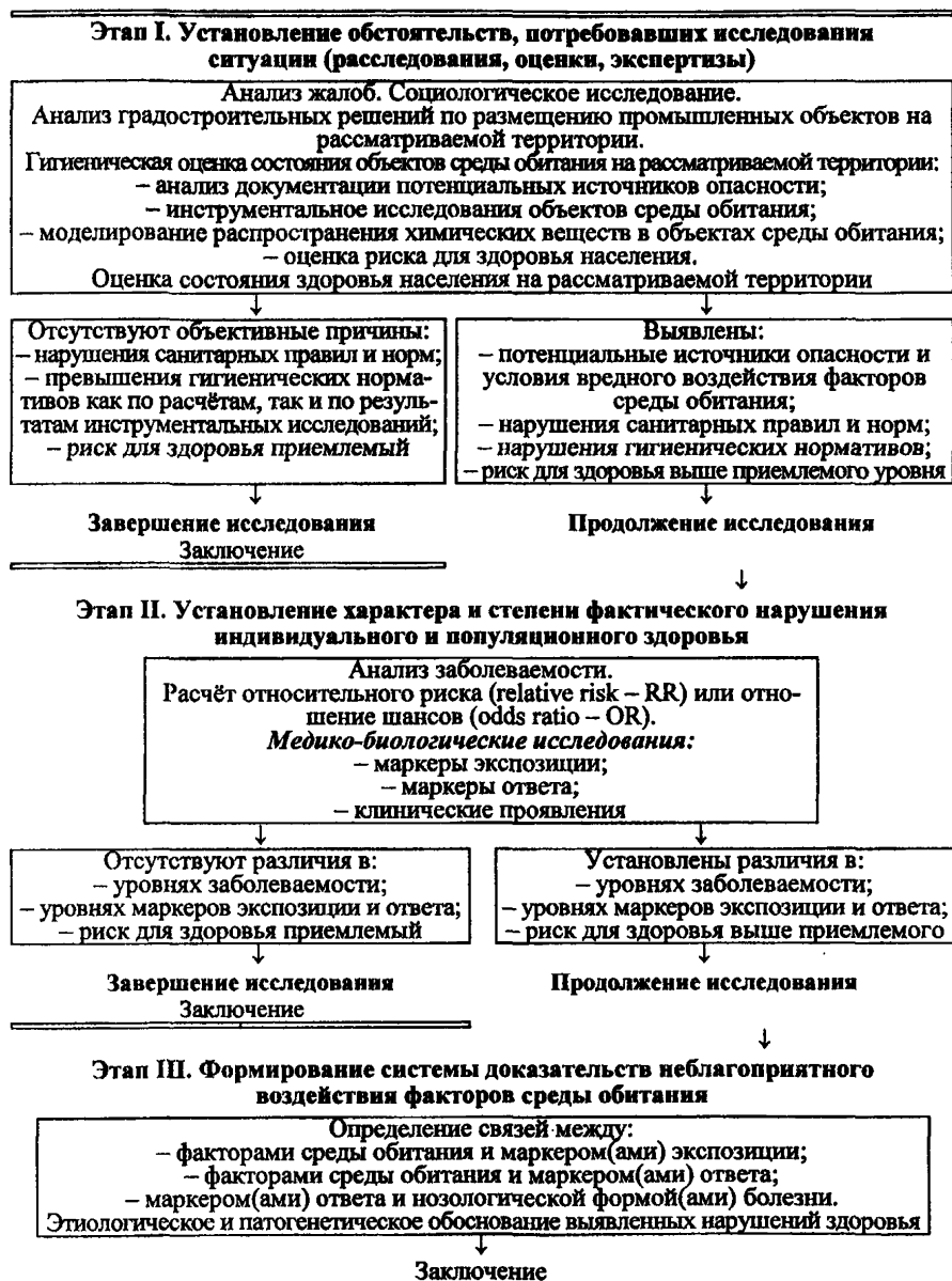
Рис. 1. Алгоритм исследования и формирования доказательной базы причинения вреда здоровью населения негативным воздействием факторов среды обитания