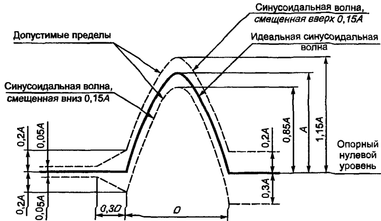
Рисунок 2 — Форма полусинусоидального импульса ускорения и его допустимые пределы