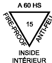
Рисунок 2 — Пример маркировки

Пример маркировки прозрачного термически закаленного безопасного стекла с основным стеклом толщиной 15 мм, имеющего тип огнестойкости «А-60», приведен на рисунке 2.