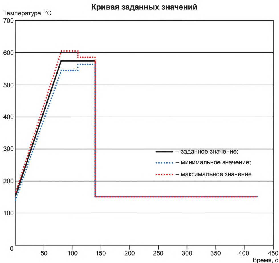
Рисунок 1 — Диаграмма температуры — времени цикла испытания кривой заданных значений с допустимыми смещениями