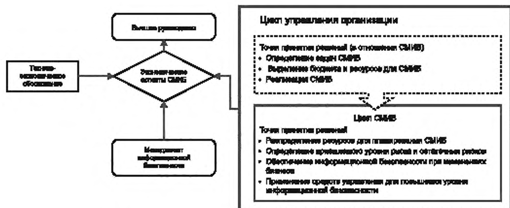
Рисунок 1 — Процесс принятия решений организационно-экономического характера в отношении ИБ с помощью настоящего стандарта

Прогнозы по временным периодам должны формироваться на базе статистики, оценок рисков и т. п. При определении временных периодов имеет смысл проконсультироваться с экспертами из всех задействованных отделов и подразделений.