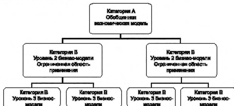
Рисунок 2 — Подход к формированию экономической модели менеджмента ИБ по принципу «снизу вверх»

Экономические модели можно разделить на две категории, приведенные в 6.2. На рисунке 2 показана иерархия применения моделей. Отдельный метод можно применять на нескольких уровнях и по возможности обобщать. Обобщение легче использовать в экономических моделях категории В ввиду ограничения их области действия.