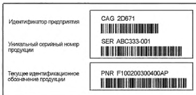
а) Данные, кодированные в формате Code 128 с добавлением визуального представления данных

6.19 На рисунках 1 и 2 представлены примеры данных идентификации изделия АТ.