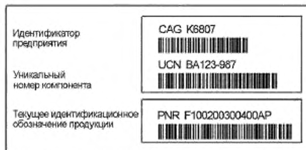
а) Данные, кодированные в формате Code 128 с добавлением визуального представления данных