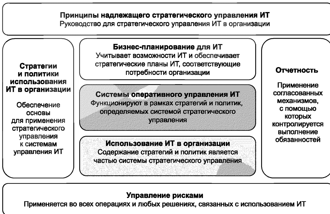
Рисунок 2 — Основные элементы системы стратегического управления ИТ

Фактическая система стратегического управления будет определяться самой организацией и зависит от ее размера и функций, а также решений руководящего органа относительно зоны ответственности, но основные элементы должны соответствовать рисунку 2. Заштрихованная область соответствует элементам управления.