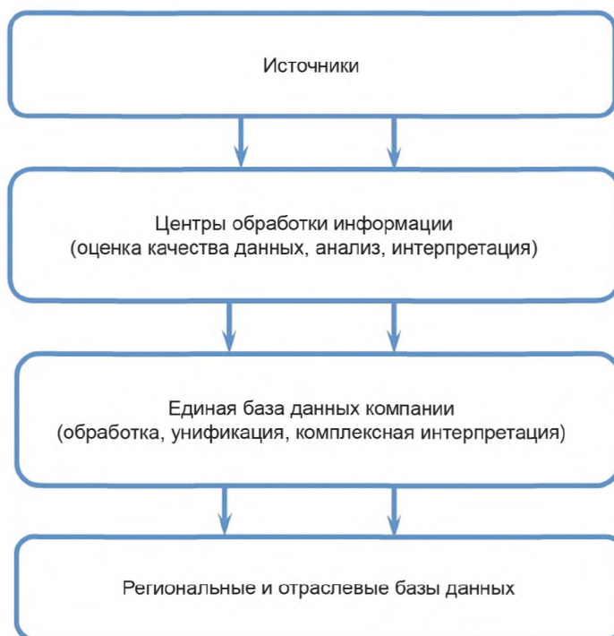
Рисунок 2 — Схема организации движения потоков геолого-технологической информации