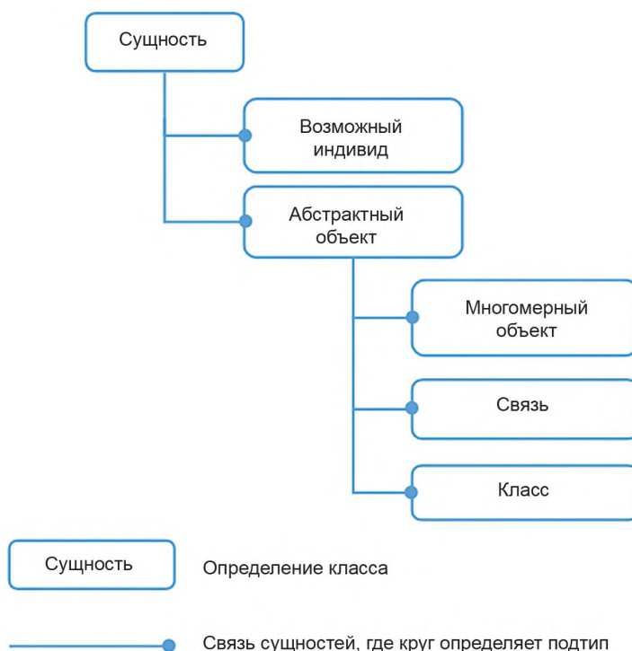
Рисунок 1 — Часть модели иерархии подтипа/супертипа

На рисунке 1 показана модель данных, представляющая основные понятия и связи между ними. Концептуальная модель данных спроектирована в соответствии с ГОСТ Р ИСО 15926-2.