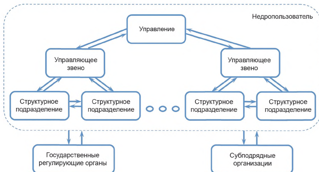
Рисунок 3 — Схема информационных потоков нефтегазового предприятия

6.1.1 На рисунке 3 представлена схема информационных потоков геолого-технологической информации нефтегазового предприятия.