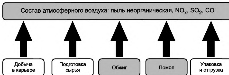
Рисунок 1 — Принципиальная блок-схема производства цемента, где основное воздействие оказывается на атмосферный воздух

Сбросов загрязняющих веществ в водоемы и образования твердых отходов при производстве цемента практически не происходит.