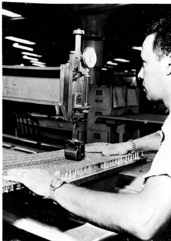
Рисунок 1 — Толщиномер роликового типа

5.2 Толщиномер дискового типа, состоящий из плоского стола с прикрепленной жесткой рамой, как показано на рисунке 2. На раме установлен диск диаметром 25 мм, имеющий вертикальный ход. Вертикальное перемещение диска передается на циферблатный индикатор с ценой деления 0,01 мм, с помощью которого регистрируют значение положительного или отрицательного отклонения от заданного номинального размера. Диск оказывает на материал внутреннего слоя «сэндвич»-конструкций нагрузку, равную 24 Н.