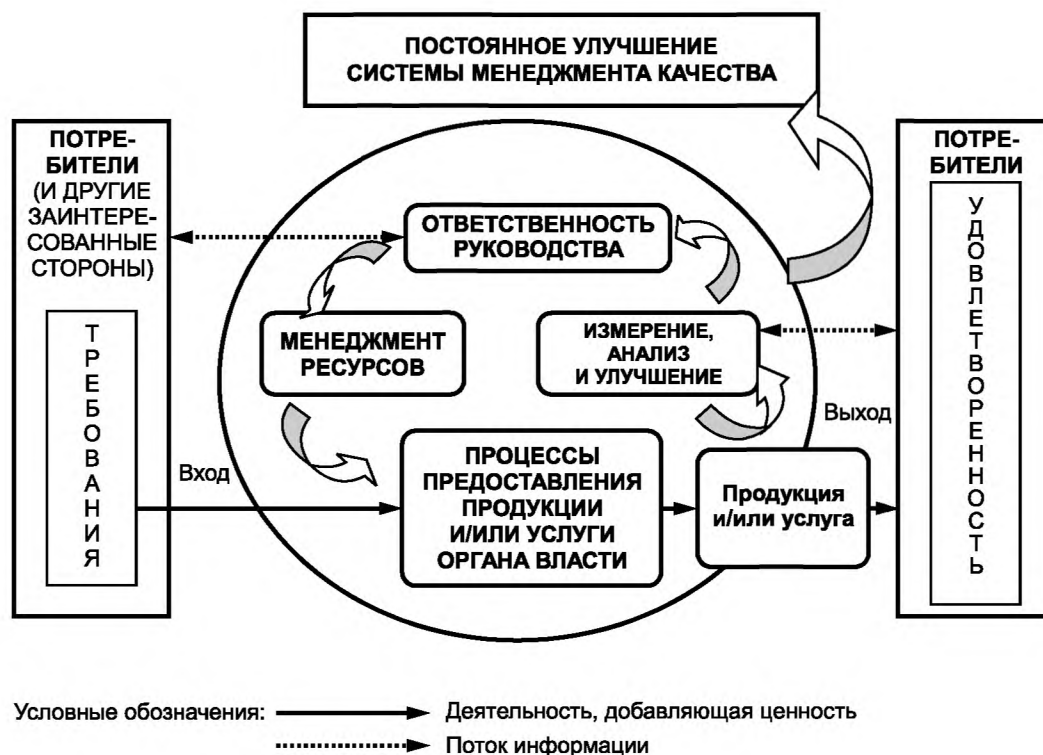
Рисунок А.1 — Модель системы менеджмента качества органа власти, основанной на процессном подходе

Приведенная на рисунке А.1 модель охватывает все основные требования настоящего стандарта, но не показывает процессы на детальном уровне.