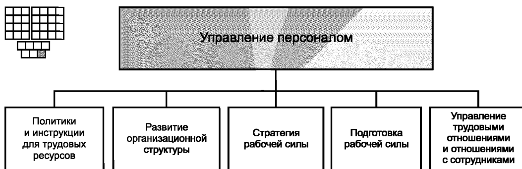
Рисунок 3 — Декомпозиция группы процессов «Управление персоналом» на элементы процессов уровня 2

6.1 Структура группы процессов «Управление персоналом» и соответствующие элементы процессов уровня 2 приведены на рисунке 3. На рисунке 3 представлена также пиктограмма, которая является общей для всех элементов процессов уровня 2.