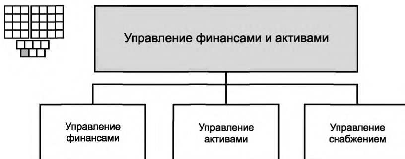
Рисунок 3 — Деконпозиция группы процессов «Управление финансами и активами» на элементы процессов уровня 2

6.1 Структура группы процессов «Управление финансами и активами» и соответствующие элементы процессов уровня 2 приведены на рисунке 3. На рисунке 3 представлена также пиктограмма, которая является общей для всех элементов процессов уровня 2.