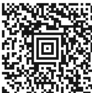
Рисунок А.5 — Символ Aztec Code с повреждением фиксированных шаблонов