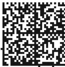
Рисунок А.3 — Тестовый символ для параметра «повреждение фиксированных шаблонов» (Fixed Pattern Damage) (символ Data Matrix)

На рисунке А.4 представлен символ QR Code с повреждением сегментов фиксированных шаблонов и шаблона информации о формате 3) , которые приведены в таблице А.3.