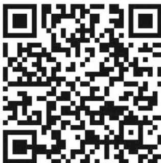
Рисунок А.4 — Символ QR Code с повреждением фиксированных шаблонов

На рисунке А.5 представлен символ Aztec Code с повреждением сегментов фиксированных шаблонов 1), 2) .