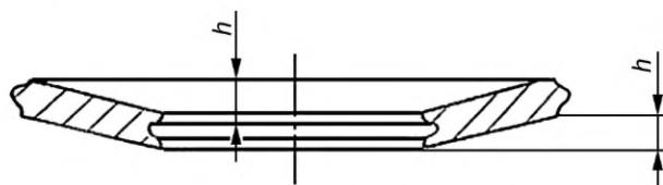
Рисунок 2 — Допуск плоскостности

5.10 Допуск плоскостности h прокладок, представленный на рисунке 2, не должен превышать значений, указанных в таблице 5.