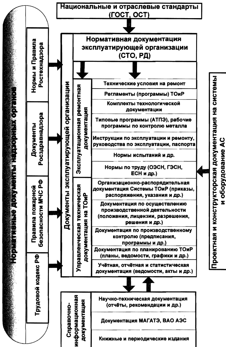
Рисунок 6.1 - Структура документации, составляющей информационное обеспечение ремонта систем и оборудования АС».