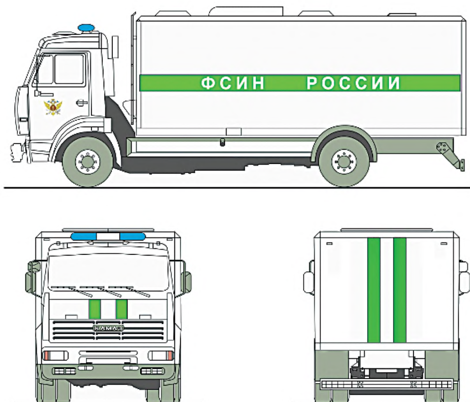
Рисунок А.70 — Цветографические схемы автомобилей уголовно-исполнительной системы Российской Федерации.

Приложение В. Таблица В.1. Графа «Номер по Картотеке цветов RAL». Для цвета покрытия «Зеленый» дополнить словами: «RAL-6018».