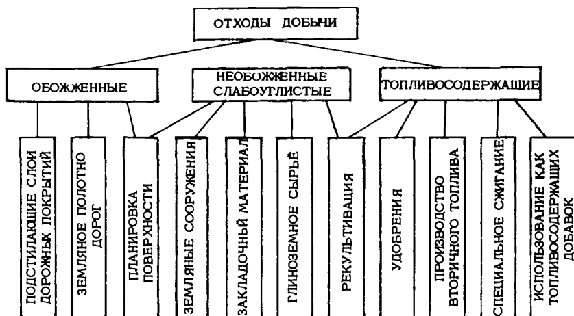
РИС. 1. ВОЗМОЖНЫЕ НАПРАВЛЕНИЯ УТИЛИЗАЦИИ ОТХОДОВ ДОБЫЧИ УГЛЕЙ