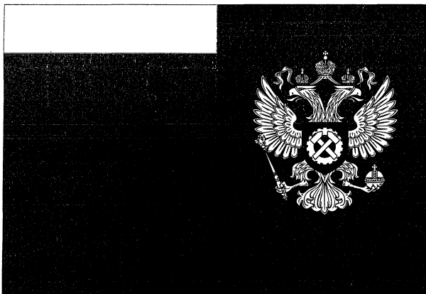
Рисунок флага Федеральной службы по труду и занятости

Приложение № 5 к приказу Министерства труда и социальной защиты Российской Федерации от 12 ноября 2012 г. № 521н