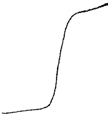
Рис. Полярографическая волна восстановления цинка в хлоридно-аммиачном растворе. Концентрация цинка 15 мкг/мл

В I M хлоридно-аммиачном растворе волна восстановления цинка (см.рис.) лежит в пределах приложенного напряжения поляризации от 1,2 до 1,6 в (НКС). Потенциал полувольты (ПНВ) равен - 1,40 в (НКС).