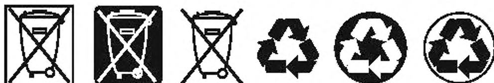
Рисунок А.5 — Символы для сбора и переработки батарей

Символы, показанные на рисунке А.5, перечислены в приложении 1 к настоящему закону.