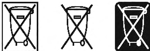
Рисунок А.4 — Символы для сбора батарей

Символы, показанные на рисунке А.4, перечислены в приложении 3 к Резолюции № 17 от 3 сентября 2012 г. http://pesquisa.in.gov.br/imprensa/jsp/visualiza/index.jsp?data=04/09/2012&jornal=1&pagina=154&totalArquivos=204