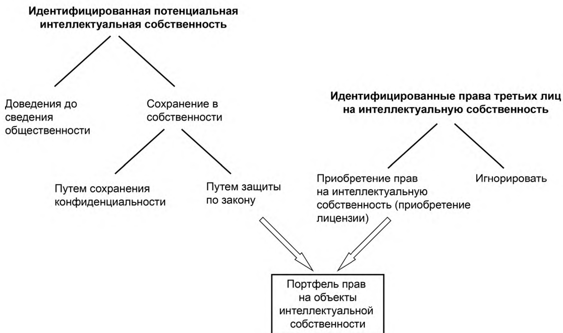
Рисунок 1 — Дерево решений в части интеллектуальной собственности

Управление портфелем прав на объекты интеллектуальной собственности должно удовлетворять требованиям заказчика, соответствовать конкретной сфере товарного производства, а также уровню совместных действий и уровню охраны/защиты, установленному для конкретной территории (см. 6.4).