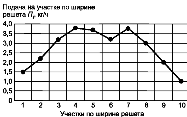
Рисунок Г.1 — График распределения обрабатываемого материала по ширине решета

Г.1.5 Результаты измерений записывают в ведомость учета количества материала, поступающего на участки решета по форме Г.1 (приложение Г). По результатам измерений и расчетов строят график распределения обрабатываемого материала по ширине решета в соответствии с рисунком Г.1 (приложение Г), который характеризует равномерность распределения материала по ширине решета.