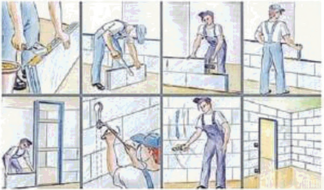
Рисунок 1. Последовательность устройства пазогребневых плит