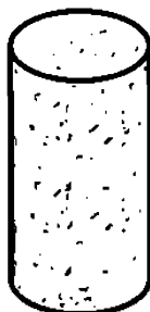
Рисунок 2 — Агломерированная корковая пробка

4.1.2 Агломерированные корковые пробки — это пробки, корпус которых целиком состоит из агломерата (рисунок 2). Пробки этого типа не следует использовать для игристых вин.