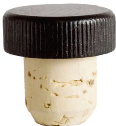
а) Со снятой фаской на конце