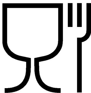
Рисунок Б.1 — Укупорочные средства, предназначенные для контакта с пищевой продукцией

Б.2 Символ, обозначающий, что изделие предназначено для контакта с пищевой продукцией, наносят непосредственно на пробку или указывают в сопроводительной документации (см. рисунок Б.1).