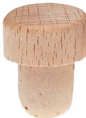
г) Округленные на конце