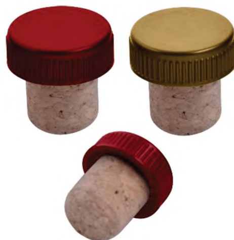
б) С корпусом из агломерированной пробки