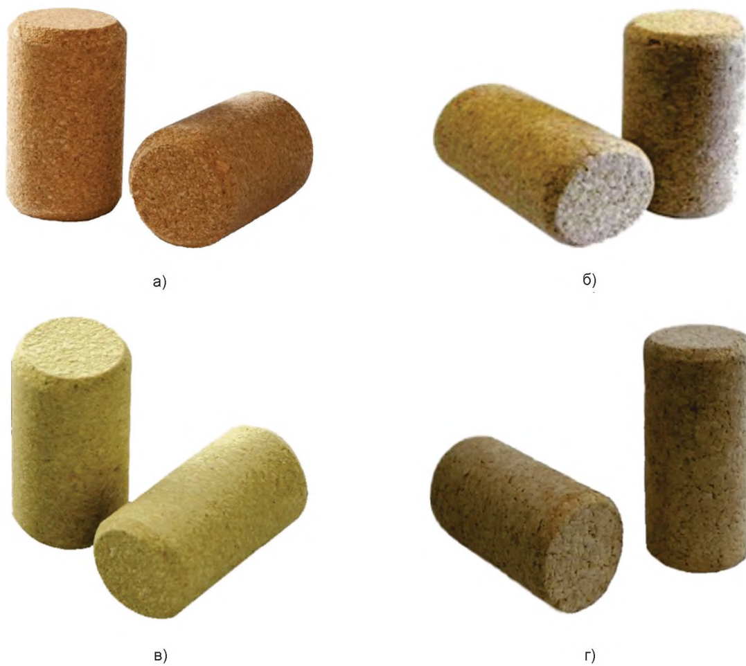
Рисунок А.5 — Пробки корковые микроагломерированные цилиндрические со снятой фаской для тихих вин