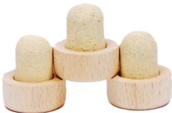
а) С корпусом из микроагломерированной пробки