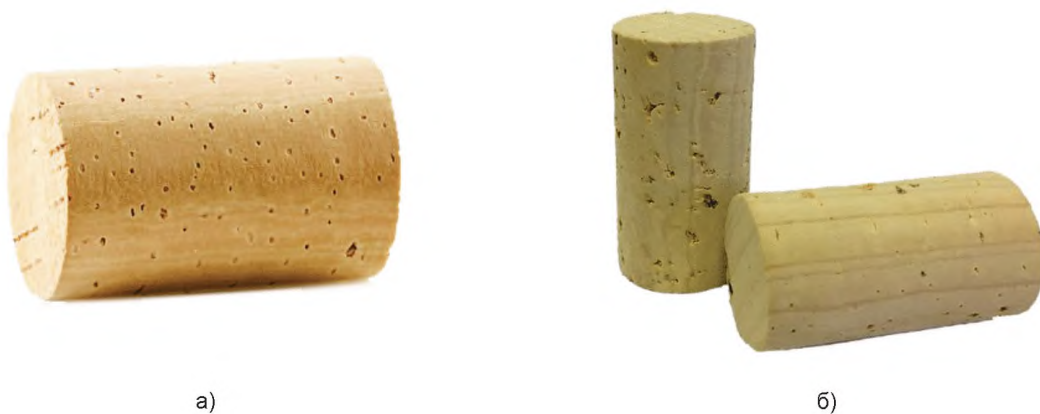
Рисунок А.1 — Пробки корковые натуральные цилиндрические