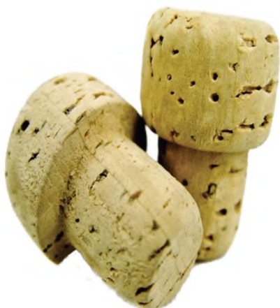
в) Округленные на конце