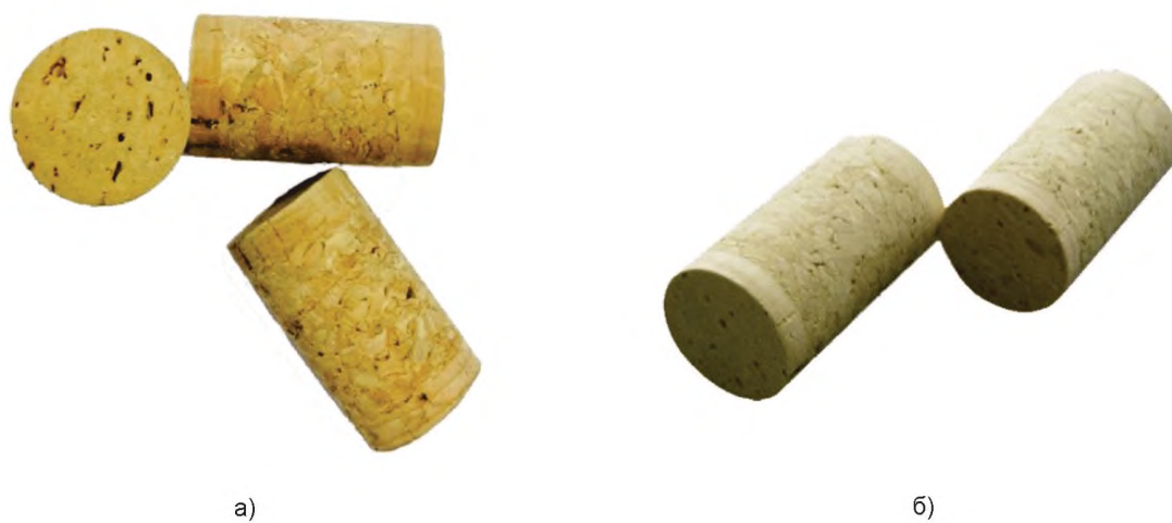
Рисунок А.6 — Пробки корковые «1+1» цилиндрические для тихих вин