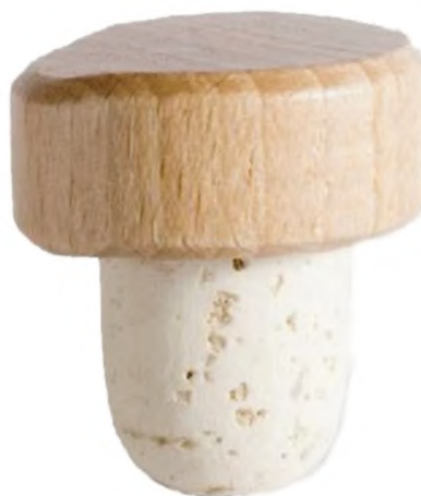
б) Округленные на конце