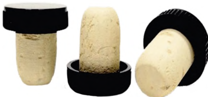
Рисунок А.9 — Т-образные корковые пробки (пробки корковые с дополнительным верхом) с корпусом из кольматированной натуральной пробки